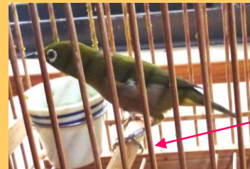
飼養登録を受けたメジロ