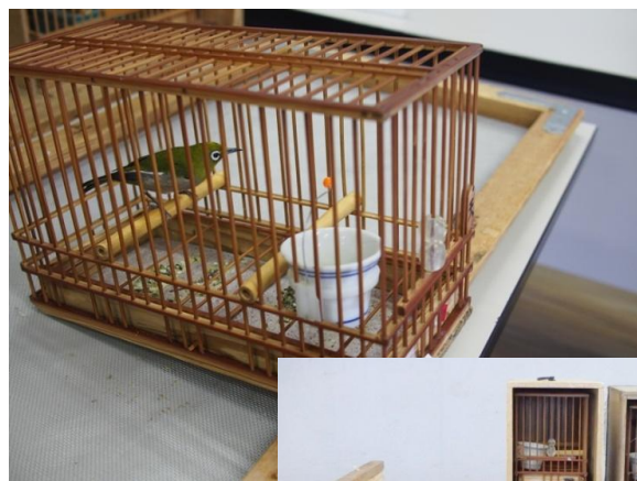
警察に押収されたメジロ